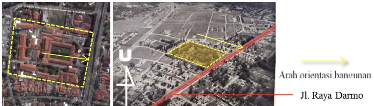
Gambar 10 Orientasi Rumah Sakit Darmo mengikuti pergerakan matahari

Pada desain rumah sakit Darmo tersebut terlihat betapa besar perhatian Citroen terhadap iklim tropis lembab. Bangunan Rumah Sakit Darmo berorientasi ke arah Timur (gambar 10), hal ini dilakukan untuk menghindari paparan matahari secara langsung dan merupakan salah satu upaya untuk beradaptasi dengan lingkungannya. Arah mata angin Utara dan Barat merupakan area yang kelak mendapat paparan sinar matahari paling banyak pada saat terekspos, oleh karenanya Citroen berusaha agar persebaran sinar matahari yang secara ilmiah dinilai sehat merata melalui desain tapak membujur persegi panjang dari timur ke barat.