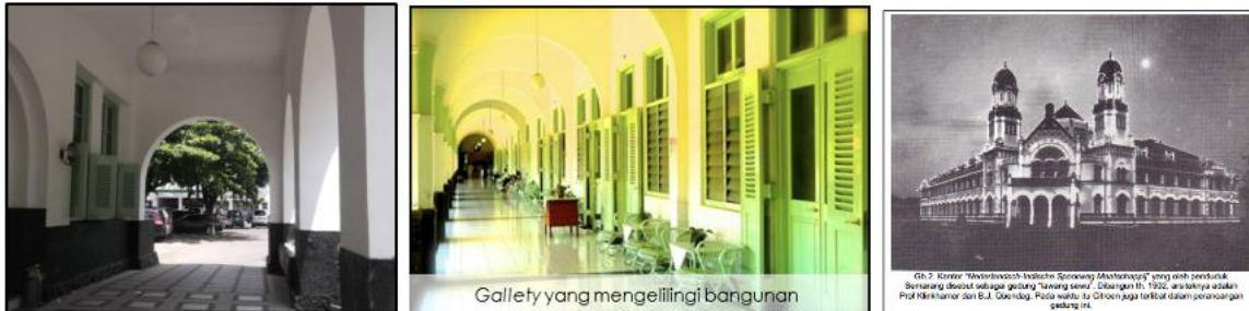
Gambar 11 Gallery yang mengelilingi bangunan RS Darmo (kiri) dan Gedung Lawang Sewu dengan gallery disekelilingnya (kanan)

Pada desain rumah sakit Darmo tersebut terlihat betapa besar perhatian Citroen terhadap iklim tropis lembab. Bangunan Rumah Sakit Darmo berorientasi ke arah Timur (gambar 10), hal ini dilakukan untuk menghindari paparan matahari secara langsung dan merupakan salah satu upaya untuk beradaptasi dengan lingkungannya. Arah mata angin Utara dan Barat merupakan area yang kelak mendapat paparan sinar matahari paling banyak pada saat terekspos, oleh karenanya Citroen berusaha agar persebaran sinar matahari yang secara ilmiah dinilai sehat merata melalui desain tapak membujur persegi panjang dari timur ke barat.