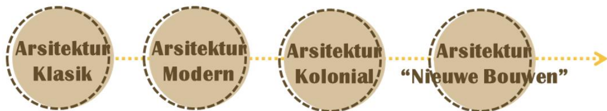
Gambar 21 Perkembangan Langgam Arsitektur pada Desain Rumah Sakit Darmo Surabaya

Nuansa art deco ditampilkan pada lorong maupun selasar rumah sakit dengan pelengkungan setengah lingkaran dan bersekat – sekat (gambar 20). Citroen berusaha menghilangkan citra bangunan kolonial yang berkesan mewah dan banyak hiasan atau ornamen dengan bangunan arsitektur Modern yang lebih menitikberatkan pada fungsi.