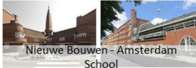
Gambar 18 Arsitektur Nieuwe Bouwen dan Amsterdam School

Adapula pendapat bahwa arsitektur kolonial muncul pada desain dikarenakan menolak langgam Empire Styl dari Perancis[26]. Maka dikembangkan gaya kolonial yang kental dengan ornamen art deco melalui bentuk bentuk yang sedikit abstrak namun masih memegang prinsip dekorasi yang minimal.