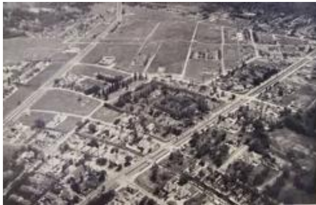
Gambar 3 Daerah Darmo dengan titik fokus foto pada RS Darmo dan sekitarnya tahun 1920