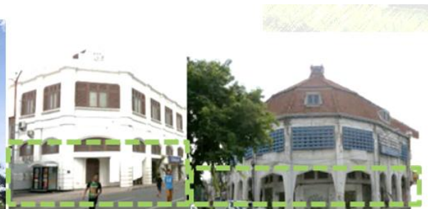
Salah satu ciri khas desain arsitektur kolonial, gallery dengan naungan yang mengelilingi bangunan.