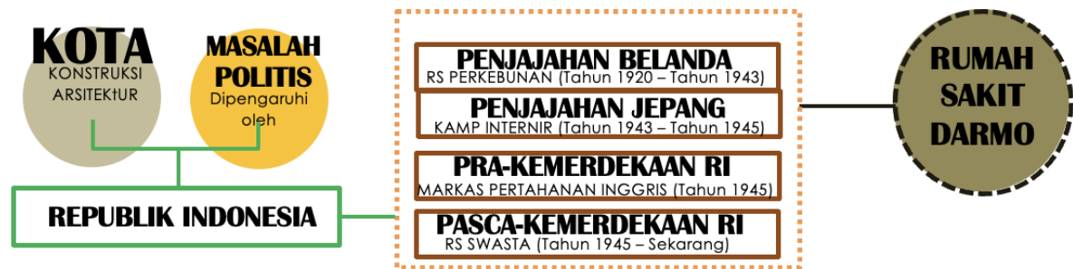
Gambar 6 Diagram timeline perkembangan sejarah Rumah Sakit Darmo Surabaya

Metode pengkajian dalam studi kota dianalisa melalui komparasi secara historis maupun analogi linguistik terkait dengan kompleksitas suatu proses perubahan bentuk dan ketepatannya[19]. Hal ini terkait dengan kota yang dipandang sebagai sebuah konstruksi arsitektur yang perkembangannya dapat bersinggungan erat dengan masalah politis, yaitu bagaimana sebuah kota merealisasikan dirinya melalui gagasan kota itu sendiri. Dalam hal ini perkembangan kesejarahan rumah sakit Darmo terkait erat dengan isu politis Indonesia[20], dimana bangunan ini berdiri ketika terjadi penjajahan Belanda, hingga perkembangannya ketika terjadi peralihan kekuasaan kepada Jepang maupun Inggris, sampai ke era Pra-Kemerdekaan maupun Pasca-Kemerdekaan Republik Indonesia (gambar 6). Berikut penjelasan masing – masing periode dan dampaknya pada fungsi Rumah Sakit Darmo: