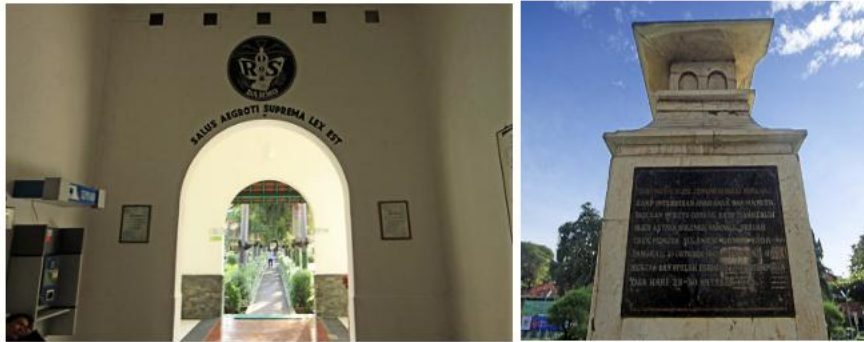
Gambar 9 (kiri) Plakat penanda sejarah dan (kanan) motto RS Darmo Surabaya

Rumah sakit Darmo merupakan salah satu fasilitas pelayanan kesehatan berdiri pertama dimasanya. Ketika dibangun, pendiri yayasan bermotto untuk sepenuh hati mengabdikan untuk kesehatan manusia. Hal ini diabadikan melalui pengulangan motto yang diukir di atas gerbang lengkung pada pintu masuk (gambar 9), yang berbunyi berbunyi “ Salus Aegroti Suprema Lex Est ” secara harafiah berarti “ Kesehatan orang sakit adalah hukum tertinggi ”. Motto tersebut diabadikan oleh salah satu penyair lagu terkenal yaitu Leo Kristi, yang kemudian diaransemen pada lirik lagunya, menjadikan memori bagi yang mendengarnya, merujuk kepada motto fungsi asli RS Darmo.