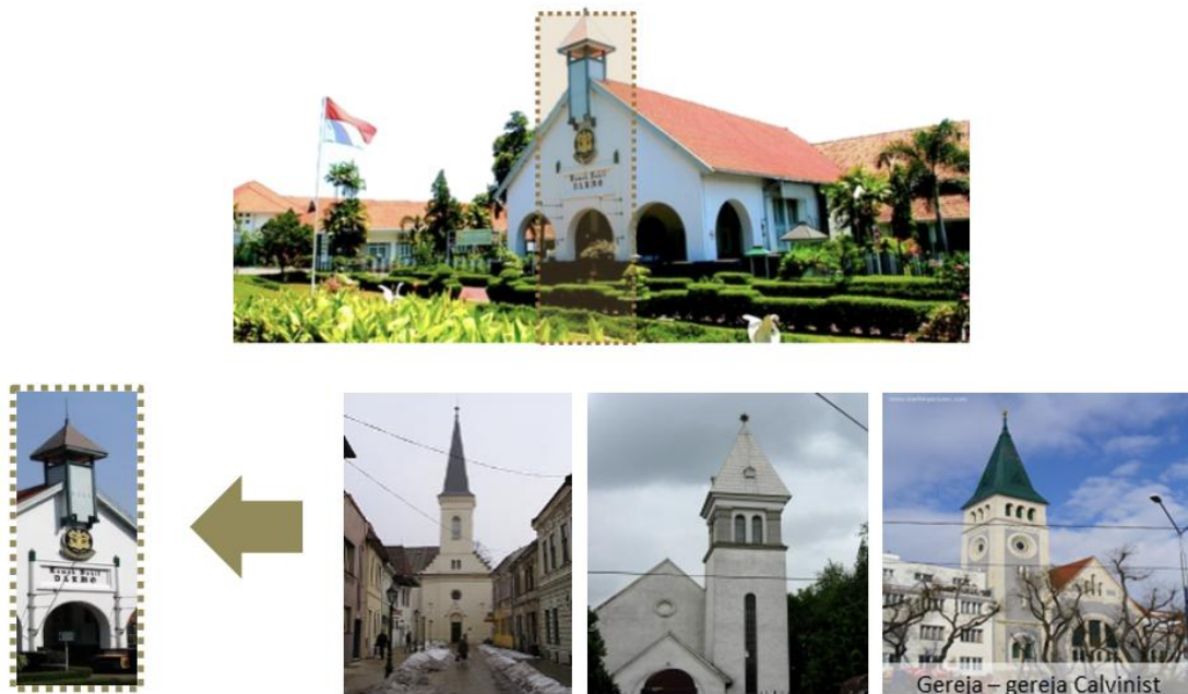
Gambar 12 Atas, Menara pada RS Darmo. Bawah, contoh preseden gereja Calvinist

Menara pada Rumah Sakit Darmo (gambar 12) merupakan salah satu elemen arsitektural yang mencolok dan memiliki kemiripan dengan menara pada Gereja Calvinist di Belanda, yang umumnya digunakan sebagai penanda visual kawasan. Terletak di puncak gevel , menara ini terbuat dari konstruksi kayu dengan atap sirap dan dilengkapi penangkal petir, menunjukkan kepedulian terhadap keselamatan bangunan di iklim tropis yang rawan petir. Bentuk menara yang menyerupai ciri Gereja Calvinist di Belanda yang memiliki karakter tower atau menara lonceng di pada ujung bangunan. Menara ini (gambar 12) terbuat dari kayu berada di puncak gevel , beratap sirap dengan penangkal petir di atasnya. Selain aspek simbolik, bentuk menara di RS Darmo mencerminkan pengaruh arsitektur modern Belanda yang mulai meninggalkan gaya klasik empire style , dan lebih memilih bentuk yang praktis dan fungsional.