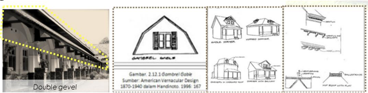
Gambar 13 (kiri) double gevel pada RS Darmo, (kanan) tipe gevel , dormer , serta ragam hias yang ditemukan pada tubuh bangunan kolonial Hindia Belanda

Menara pada Rumah Sakit Darmo (gambar 12) merupakan salah satu elemen arsitektural yang mencolok dan memiliki kemiripan dengan menara pada Gereja Calvinist di Belanda, yang umumnya digunakan sebagai penanda visual kawasan. Terletak di puncak gevel , menara ini terbuat dari konstruksi kayu dengan atap sirap dan dilengkapi penangkal petir, menunjukkan kepedulian terhadap keselamatan bangunan di iklim tropis yang rawan petir. Bentuk menara yang menyerupai ciri Gereja Calvinist di Belanda yang memiliki karakter tower atau menara lonceng di pada ujung bangunan. Menara ini (gambar 12) terbuat dari kayu berada di puncak gevel , beratap sirap dengan penangkal petir di atasnya. Selain aspek simbolik, bentuk menara di RS Darmo mencerminkan pengaruh arsitektur modern Belanda yang mulai meninggalkan gaya klasik empire style , dan lebih memilih bentuk yang praktis dan fungsional.