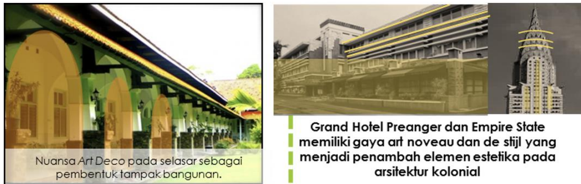
Gambar 20 Bentuk atap pelana pada RS Darmo merupakan adaptasi arsitektur kolonial serta Nieuwe Bouwen kepada iklim di Surabaya

Nuansa art deco ditampilkan pada lorong maupun selasar rumah sakit dengan pelengkungan setengah lingkaran dan bersekat – sekat (gambar 20). Citroen berusaha menghilangkan citra bangunan kolonial yang berkesan mewah dan banyak hiasan atau ornamen dengan bangunan arsitektur Modern yang lebih menitikberatkan pada fungsi.