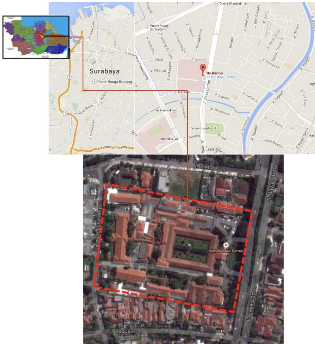
Gambar 1 Lokasi wilayah studi, Rumah Sakit Darmo, Surabaya

Ruang lingkup lokasi adalah Rumah Sakit Darmo yang berlokasi JalanRaya Darmo, Surabaya seperti yang terlihat pada gambar 1 di atas, yang masih termasuk dalam wilayah administratif Kelurahan Dr. Sutomo, Kecamatan Tegalsari, Kota Surabaya. Batas wilayahnya adalah sebagai berikut: