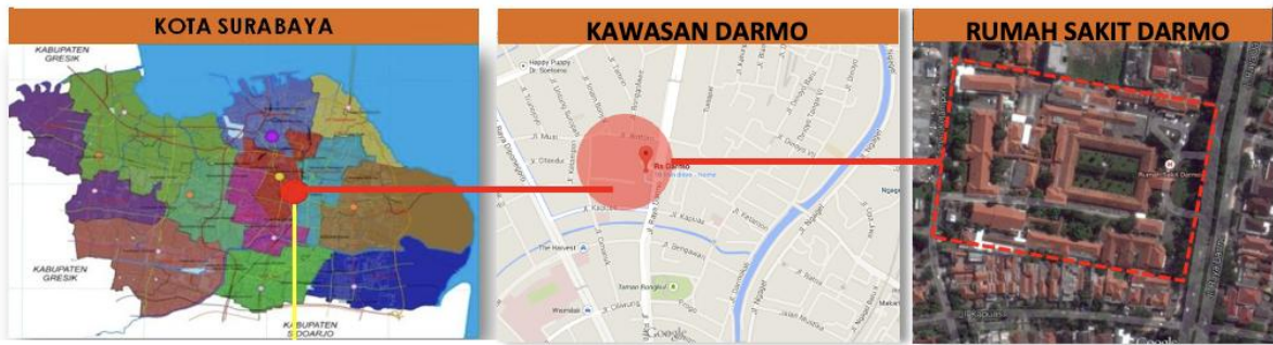
Gambar 4 Lokasi Gedung Rumah Sakit Darmo Surabaya

Jalan Raya Darmo terletak pada sisi barat bangunan artefak. Sedangkan pada bagian timur bangunan Rumah Sakit Darmo berbatasan langsung dengan Jalan Taman Ketampon, pada bagian utara berbatasan dengan jalan Bintoro dan sebelah selatan berbatasan dengan bank OCBC NISP. Rumah Sakit Darmo terletak di UP Tunjungan khususnya pada Kecamatan Tegalsari serta Kelurahan Dr. Soetomo Kota Surabaya (gambar 4).