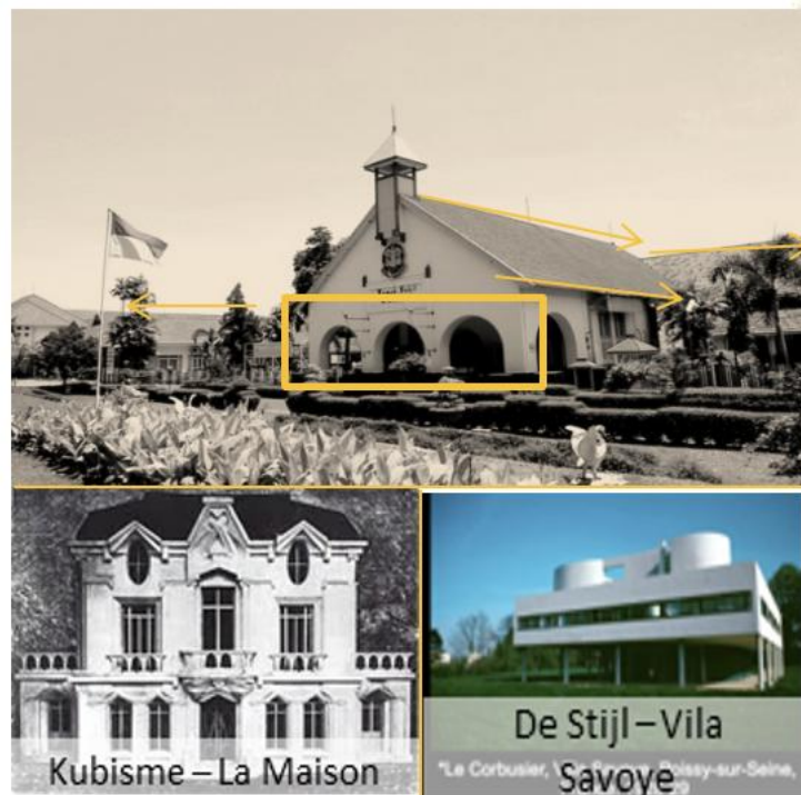
Gambar 16 Karakteristik yang ditemukan sesuai dengan langgam kolonial yang memiliki gaya kubisme dan de stijl

mengedepankan fungsi dengan penggunaan warna – warna pucat dan bentuk – bentuk lugas maupun simpel.