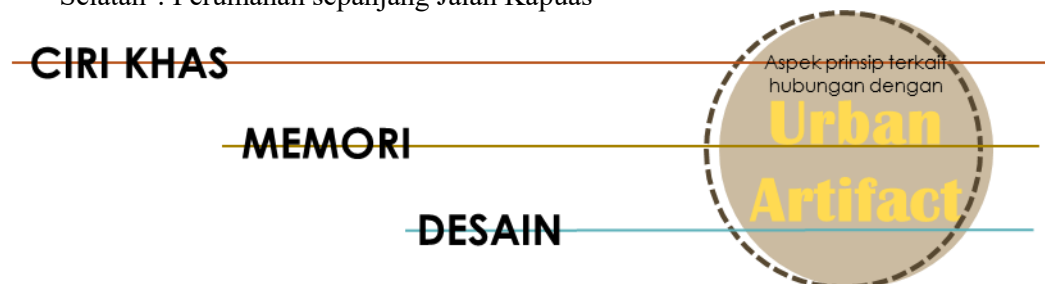
Gambar 2 Diagram Aspek Penanda Artefak Kota dinilai sebagai Individu