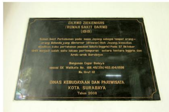
Gambar 7 (Kiri) Sebuah prasasti di halaman depan Rumah Sakit Darmo (Kanan) Sertifikasi cagar budaya RS Darmo

Ketika pasukan sekutu datang maka terjadi peralihan kekuasaan sehingga rumah sakit Darmo diduduki oleh Inggris. Pada tanggal 27 Oktober 1945, terjadi pertempuran antara tentara sekutu dengan para pemuda Surabaya. Pertempuran tersebut mengawali terjadinya peristiwa 10 November 1945. Gedung ini merupakan benteng pertahanan oleh pasukan Inggris yang dipimpin Brigade Jenderal AWS Mallaby. Untuk mengenang kejadian tersebut, didirikan prasasti