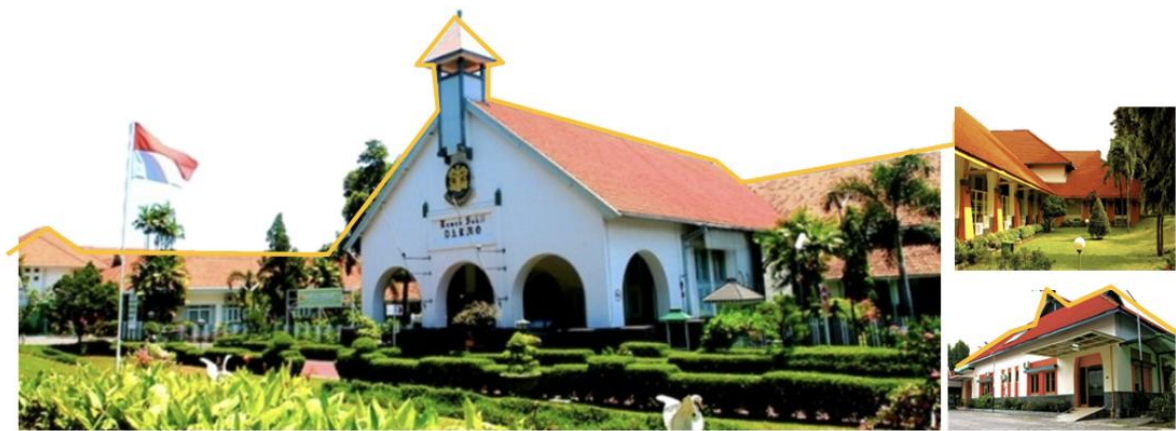
Gambar 19 Bentuk atap pelana pada RS Darmo merupakan adaptasi arsitektur kolonial serta Nieuwe Bouwen kepada iklim di Surabaya

Nieuwe Bouwen merupakan langgam yang berkembang seiring dengan arsitektur modern, terdapat indikasi perpaduan kubisme dengan de stijl , dimana kedua langgam ini lebih mengedepankan fungsi dibanding estetika/dekoratif[23]. Nieuwe Bouwen merupakan usaha Belanda dalam mengembangkan arsitektur khas milik mereka, sehingga langgam ini sering juga disebut amsterdam school [24] (gambar 18)