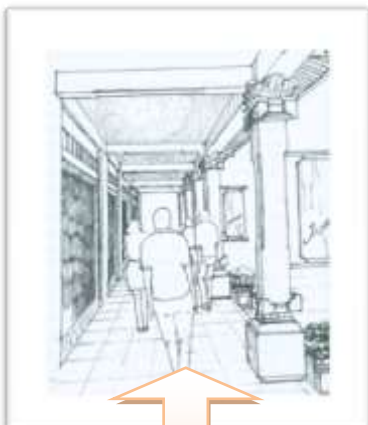
Gambar VI. 2 Rekomendasi rancangan pedestrian di daerah pertokoan