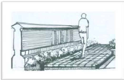
Gambar VI.1 Rekomendasi rancangan pedestrian jl. Thamrin