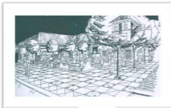
Gambar VI.3 Rekomendasi rancangan open space kawasan persimpangan jl. Thamrin dgn jl. G. Merapi