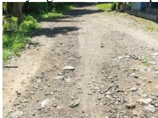
Gambar 3. Cakupan Pelayanan Jalan di Kawasan Pesisir Muncar Tahun 2023

Berdasarkan penelitian bahwasannya keteraturan bangunan dinilai sebesar 36%, yang menunjukkan bahwa tingkat keteraturan berada pada kategori cukup baik, meskipun masih ada ruang untuk perbaikan. Dua hal yang dievaluasi adalah keteraturan dan kepadatan bangunan. Keteraturan bangunan membutuhkan peningkatan pemeliharaan, khususnya dalam hal penerapan aturan seperti Koefisien Dasar Hijau (KDH), Koefisien Lantai Bangunan (KLB), Koefisien Dasar Bangunan (KDB), dan Garis Sempadan Bangunan (GSB). Tujuannya adalah menurunkan nilai ketidakteraturan dari 36% menjadi di bawah 25%, sehingga kondisi bangunan dapat ditingkatkan dari cukup baik menjadi baik. Sedangkan, dalam hal kepadatan bangunan, rekomendasinya adalah untuk memastikan agar penggunaan lahan tetap terkendali dan kepadatan bangunan tidak meningkat. Masyarakat juga diharapkan untuk selalu mematuhi peraturan yang berlaku guna menjaga kestabilan kepadatan bangunan. Secara keseluruhan, rekomendasi yang diberikan mencakup peningkatan pemeliharaan dan pengelolaan bangunan sesuai dengan aturan yang ada, serta pentingnya menjaga kesadaran masyarakat untuk terus mengikuti regulasi demi mempertahankan kondisi bangunan yang lebih tertib dan padat secara terkendali.