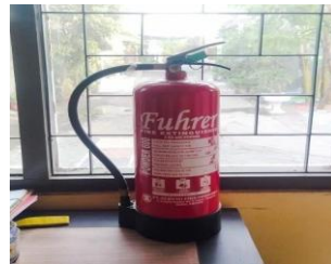
Gambar 10. Sarana Proteksi Kebakaran di Kawasan Pesisir Muncar Tahun 2023

Pengolahan Air Limbah terdiri dua aspek utama yaitu standar pengolahan air limbah dan ketersediaan fasilitas mandi, cuci, kakus (MCK). Pada aspek tidak sesuai standar pengolahan air limbah, nilai yang diperoleh adalah 51%, yang menunjukkan bahwa pengolahan air limbah berada pada kategori sedang namun kurang baik. Hal ini menunjukkan bahwa sistem pengelolaan air limbah di wilayah tersebut belum memadai dan perlu ditingkatkan. Sementara itu, untuk aspek tidak memiliki MCK, wilayah tersebut mendapat nilai 4%, yang menunjukkan bahwa ketersediaan fasilitas MCK sudah tergolong baik dan bukan menjadi masalah utama di wilayah ini. Rekomendasi untuk meningkatkan standar pengolahan air limbah adalah dengan mewajibkan setiap bangunan untuk memiliki septic tank, terutama septic tank bio, yang lebih efektif dalam menguraikan limbah padat dan mengurangi bakteri dalam air limbah. Langkah ini diharapkan dapat menurunkan nilai pengelolaan air limbah dari 51% menjadi di bawah 25%, sehingga kualitas pengelolaan air limbah bisa meningkat dari kurang baik menjadi baik. Meskipun fasilitas MCK sudah dinilai baik, tetap direkomendasikan pembangunan MCK umum di beberapa titik di wilayah pesisir Muncar. Selain itu, masyarakat dihimbau untuk membangun MCK di setiap bangunan, sehingga sanitasi dapat semakin memadai dan memenuhi standar yang lebih baik.