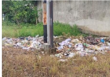
Gambar 7. Tidak Memiliki TPS di Kawasan Pesisir Muncar Tahun 2023

Berdasarkan Gambar 6. tersebut menunjukkan bahwa di kawasan pesisir Muncar TPS nya tidak sesuai standard yang ada, karena TPS yang tersedia membuat sampah menjadi satu atau tercampur.