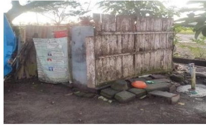
Gambar 9. MCK Luar Bangunan di Kawasan Pesisir Muncar Tahun 2023

Berdasarkan Gambar 9. tersebut menunjukkan bahwa dikawasan pesisir Muncar ada beberapa wilayah yang tidak memiliki MCK sendiri dibangun yang dibangun, hal tersebut karena masih menggunakan MCK yang diluar bangunan atau menggunakan MCK Helicopter di tepi Sungai.