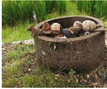
Gambar 6. Tidak Sesuai Standard di Kawasan Pesisir Muncar Tahun 2023

Berdasarkan Gambar 6. tersebut menunjukkan bahwa di kawasan pesisir Muncar TPS nya tidak sesuai standard yang ada, karena TPS yang tersedia membuat sampah menjadi satu atau tercampur.