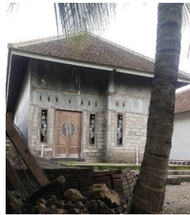
Gambar 2. Kepadatan Bangunan di Kawasan Pesisir Muncar Tahun 2023

Pada analisis pengembangan kawasan permukiman kumuh di kawasan pesisir Muncar, mengambil beberapa teori yang digunakan untuk referensi atau tinjauan seperti green construction dan arsitektur berkelanjutan, dari hal tersebut mendapatkan hasil bahwa dari aspek bangunan dan jalan bisa menggunakan opsi ketika mendirikan, memperbaiki atau membangun dengan mencampur adonan atau konstruksi yang ada dengan tumbuhan maupun bahan bekas seperti plastik yang bisa bikin efisien dan membuat bangunan tetap kokoh dan ramah lingkungan. Pada aspek drainase, air minum, pengolahan sampah, pengolahan air limbah, dan proteksi kebakaran menggunakan teori arsitektur berkelanjutan, dimana dari teori tersebut menyatakan diperlukannya sistem kinerja terbaru yang berkelanjutan dan ramah lingkungan. Contohnya dari aspek proteksi kebakaran sendiri memanfaatkan air sungai guna untukantisipasi terjadinya kebakaran dan bisa digunakan juga untuk suplai truk pemadam kebakaran apabila terjadinya kebakaran.