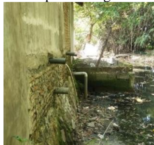
Gambar 8. Tidak Sesuai Standard Pengolahan Limbah di Kawasan Pesisir Muncar Tahun 2023

Berdasarkan Gambar 8. tersebut menunjukkan bahwa di kawasan pesisir Muncar masih banyak bangunan yang memiliki MCK akan tetapi tidak sesuai standard seperti tidak memiliki pembuangan limbah septic tank atau membuang limbah secara langsung di sungai.