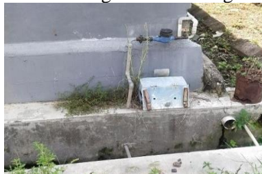
Gambar 5. Ketersediaan Air Minum di Kawasan Pesisir Muncar Tahun 2023

Drainase mencakup aspek cakupan pelayanan dan kondisi pemeliharaan drainase. Berdasarkan penilaian, cakupan pelayanan drainase memperoleh nilai 74%, yang menandakan kategori tingkat sedang, dengan kondisi yang tergolong cukup baik. Namun, ada ruang untuk perbaikan agar cakupan pelayanan menjadi lebih baik. Sedangkan, pada aspek kondisi terpeliharanya drainase, nilai yang didapat adalah 53%, menunjukkan bahwa kondisi drainase kurang terpelihara, dan berada dalam kategori sedang, namun masih kurang baik. Rekomendasi untuk meningkatkan cakupan pelayanan mencakup pembangunan sistem drainase yang saling terhubung, sehingga cakupan drainase di wilayah tersebut dapat meningkat. Harapannya, nilai cakupan pelayanan yang saat ini 74% dapat turun di bawah 25%, sehingga dari cukup baik menjadi baik. Untuk aspek terpeliharanya drainase, direkomendasikan adanya perbaikan dari segi fisik dan kinerja saluran drainase, misalnya dengan menerapkan sistem konstruksi tertutup dan biopori. Dengan perbaikan ini, nilai yang saat ini 53% diharapkan bisa turun di bawah 25%, sehingga kualitas pemeliharaan drainase meningkat dari kurang baik menjadi baik.