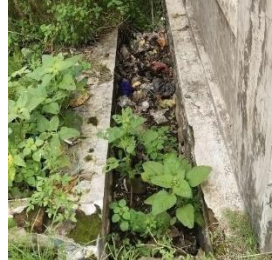
Gambar 4. Kondisi Drainase di Kawasan Pesisir Muncar Tahun 2023

jalan lainnya, sehingga cakupan layanan dapat meningkat. Diharapkan, nilai cakupan pelayanan yang saat ini 35% bisa turun menjadi di bawah 25%, dan cakupan jalan dapat ditingkatkan dari cukup baik menjadi baik. Sedangkan untuk meningkatkan kualitas jalan, direkomendasikan untuk memperbaiki jalan-jalan yang rusak seperti yang berlubang, retak, atau bergelombang. Tujuannya adalah agar nilai kualitas jalan yang saat ini 35% dapat diturunkan menjadi di bawah 25%, dan kualitas jalan meningkat dari cukup baik menjadi baik.